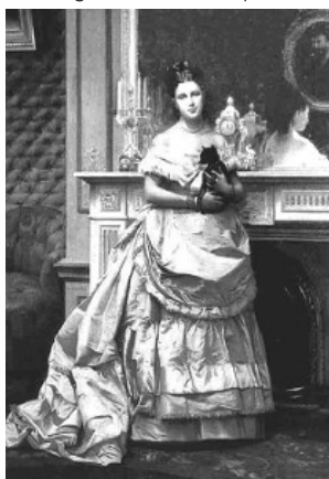
GÉROME, Retrato de uma dama , 1849.