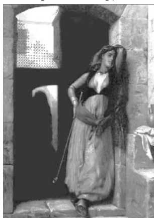
GÉROME, Almei com cachimbo , 1873. Disponível em: http://alloilpaint.com . Acesso em: 29 jun. 2015.