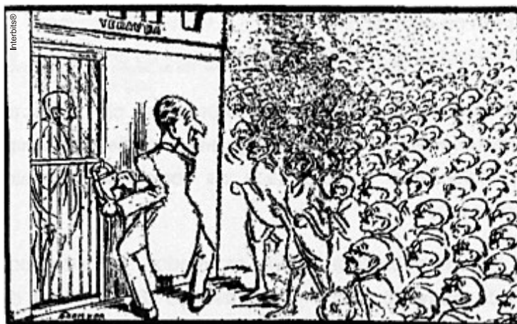
LORD WILLINGDON'S DILEMMA