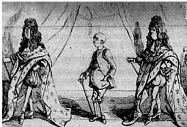
(Charge anônima. BURKE, P. A fabricação do rei . Rio de Janeiro: Zahar, 1994.)

Na França, o rei Luís XIV teve sua imagem fabricada por um conjunto de estratégias que visavam sedimentar uma determinada noção de soberania. Neste sentido, a charge apresentada demonstra